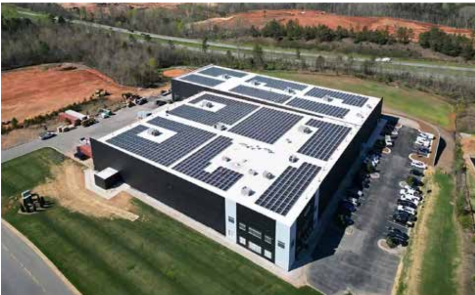
Unox Inc, USA Fabrica UNOX con paneles solares en Carolina del Norte, EEUU

Unox tiene una presencia global con más de 35 oficinas físicas en todo el mundo, apoyando operaciones en más de 110 países. Además, la empresa cuenta con 42 filiales y distribuye productos en más de 130 países.